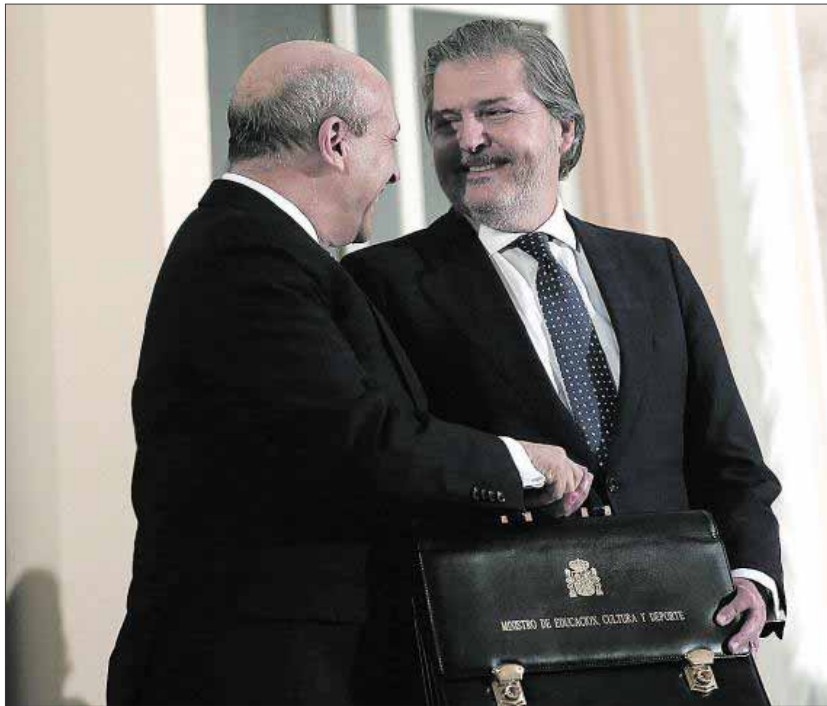
Íñigo Méndez de Vigo toma posesión de su cartera de ministro de Educación, Cultura y Deporte, el 26 de junio de 2015. EE

El aumento de las matrículas universitarias ha provocado que, de media, los estudiantes hayan tenido que pagar hasta 800 euros más en su matrícula. Educación obligó a las comunidades a aumentar, al menos el 15 por ciento del coste real del grado a los, poniendo un tope del 25 por ciento, lo que produjo desde el principio un importante encarecimiento de la primera matrícula. Es decir, que el precio del grado ha subido en torno al 65 por ciento y el del máster, un 46