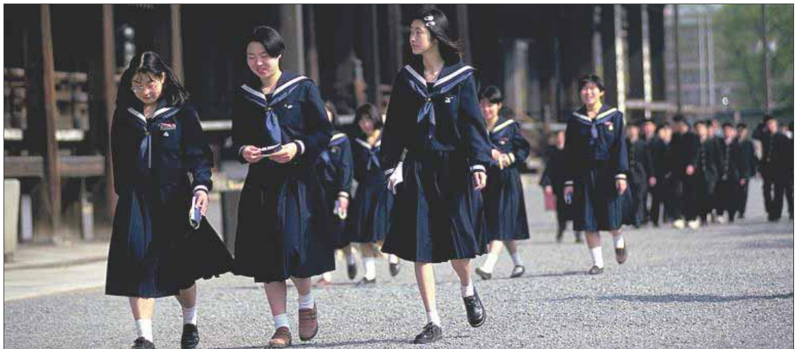
Estudiantes de secundaria caminando por los jardines de Nishi Hongan-ji, antiguo templo budista en Kyoto.

Hasta 2002, los estudiantes de primaria y secundaria asistían a la escuela seis días a la semana. El sábado fue eliminado ese año. Sin embargo, en 2014 se volvió a incorporar ese día para hacer actividades comple-