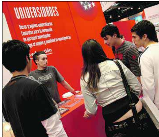
Uno de los 'stand' en la Semana de la Educación en 2014.

Cuando Joseph Pulitzer decidió nombrar a la Universidad de Columbia administradora de sus premios contribuyó a hacer de esta institución el referente mundial de los estudios de Periodismo. En el momento actual, la fina línea que separa el Periodismo de otros grados en comunicación se desdibuja para dar paso a un nuevo perfil: un profesional capaz de transmitir, de persuadir, de entretener, de formar e informar. Variará la proporción, pero estas funciones están involucradas y son todas indispensables en el valor estratégico del comunicador. Un valor que es la diferencia específica de nuestros alumnos en el proceloso mercado laboral de este apasionante servicio a la sociedad; el que presta la comunicación y el periodismo.