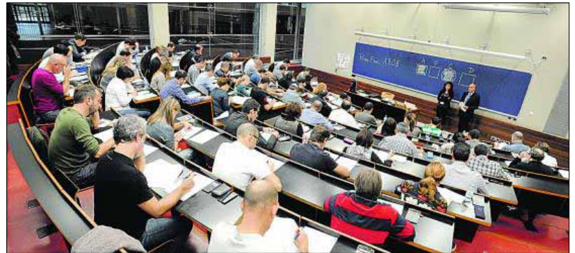
Alumnos realizando uno de los exámenes que se llevaron a cabo en el campus Ciutadella de la Universidad Pompeu Fabra, en Barcelona, donde se examinaron más de 1.000 empleados. EE

Los bancos de inversión más importantes del mundo (HSBC, Citibank, UBS, Barclays, BNP Paribas) también tienen acuerdos con el CISI para exigir a sus profesionales financieros la formación acreditada para su formación.