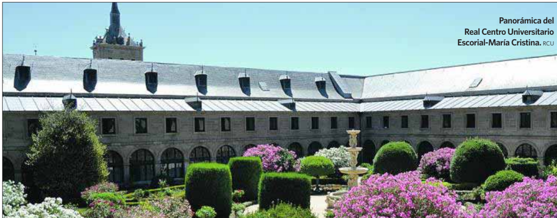
Panorámica del Real Centro Universitario Escorial-María Cristina, RCU