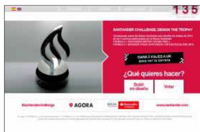
Homepage del concurso. EE

El ganador disfrutará de un viaje al Gran Premio de Inglaterra (del 4 al 6 de julio) para dos personas con entradas de tribuna. Si es cliente del propio banco, las entradas serán para el Paddock Club, la zona más exclusiva para ver las carreras, muy cerca de los garajes de los equipos. Además, conseguirá una réplica