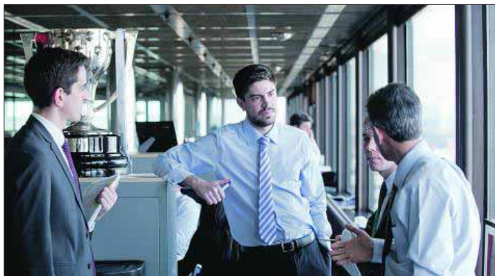
Grupo de becarios de BBVA con uno de los tutores.